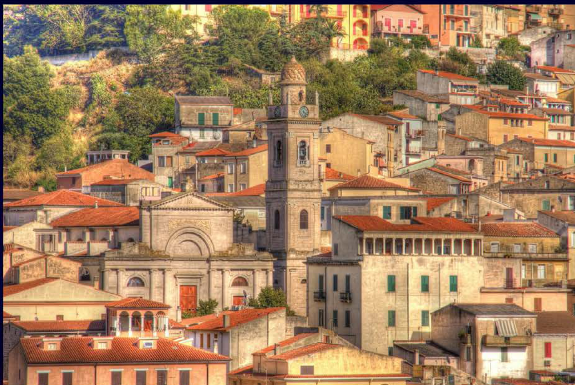
Ozieri la Cattedrale dell'Immacolata

Prèmiu Logudoro Otieri Sodalitziu Culturale Otieresu